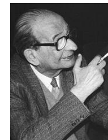
Serban TITEICA (1908-1985)