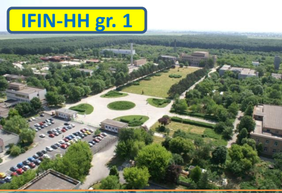
Nuclear & Vacuum