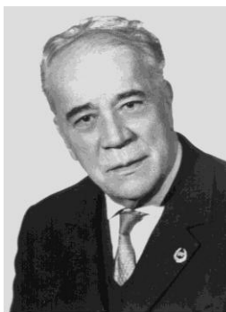
Horia HULUBEI (1896-1972)